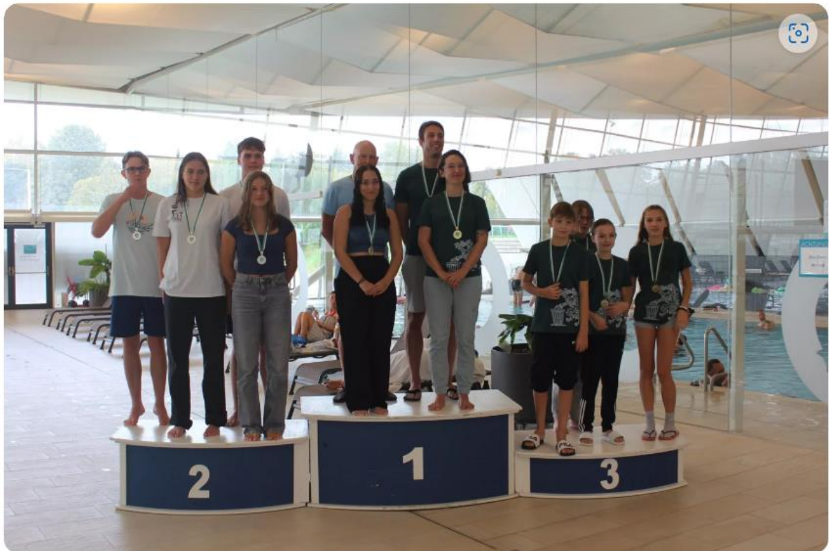
Die Jüngsten Gewinner freuen sich über ihre Siege.